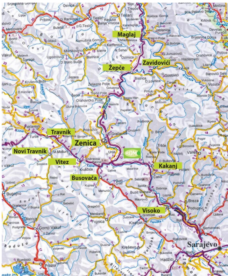
Slika 1 Općinska pripadnost zeničkoj regiji

Uspješnosti uspostave regionalnog ustroja za integralno gospodarenje otpadom treba da doprinesu planovi za integralno gospodarenje koji se donose na različitim razinama. Međutim, razvoj planskih instrumenta dinamički ne prati razvoj pravnih i institucionalnih aranžmana.